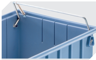
Sicherungs-/Tragebügel für Regalkästen RK 3-1514