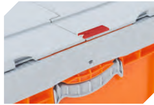
Plomben für BITOKLAPPBOX EQ 51-31438