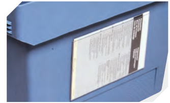
Etikettentaschen selbstklebend 3 Seiten offen L 175 x B 105 mm 6-5031