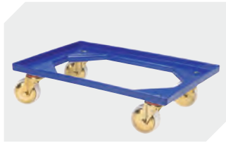
Transportroller Material Rad: PP L 620 x B 420 mm 43-1491