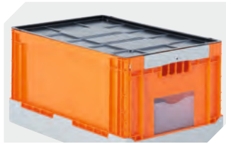
Auflagedeckel für BITOKLAPPBOX EQ L 592 x B 392 mm 51-31437