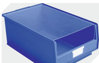
Couvercles anti-poussière pour bacs à bec, série PK l 300 x l 200 x H 2 mm 2-1135