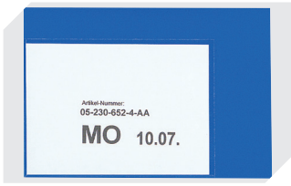
Etikettentaschen selbstklebend 2 Seiten offen L 145 x B 100 mm 46-21108