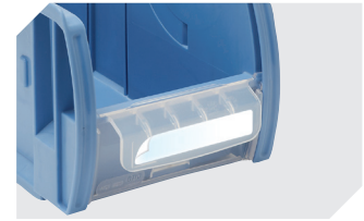
Klebefeldfolien für C-Teile-Behälter CTB 53-31308