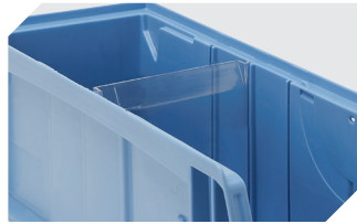
Querteiler CQT für C-Teile-Behälter CTB 53-31303