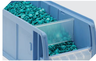
Dosierscheiben CDS für C-Teile-Behälter CTB 53-31304