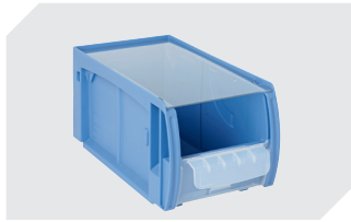
Staubdeckel CSD für C-Teile-Behälter CTB L 269 x B 148 mm 53-31341