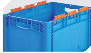
Tütenleisten demontierbar 6-31553