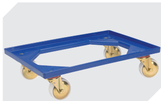
Plateaux roulants matériel des roues : PP l 620 x l 420 mm 43-1491