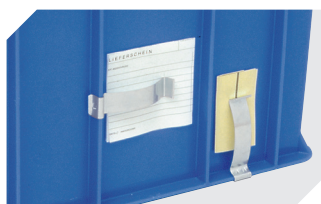
Clips porte-documents pour bacs gerb. norme Europe l 80 x l 18 mm 4-1492