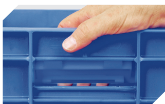
Obturateurs pour poignées ouvertes pour bacs gerb. norme Europe, série BN 4-18671