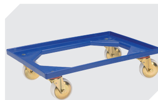
Plateaux roulants matériel des roues : PP l 620 x l 420 mm 43-1491