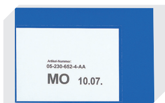
Pochettes porte-documents fixation auto-adhésive 2 côtés ouverts l 145 x l 100 mm 46-21108