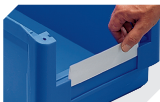
Protèges-étiquette pour bacs à bec, série SK l 178 x l 42 mm 2-1066