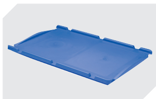
Couvercles indépendants pour bacs gerbables norme Europe, série XL l 400 x l 300 mm 43-20303