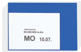
Etikettentaschen selbstklebend 2 Seiten offen L 145 x B 100 mm 46-21108