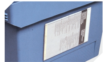
Etikettentaschen selbstklebend 3 Seiten offen L 175 x B 105 mm 6-5031