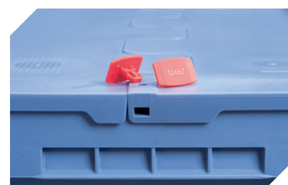
Plomben MBP2-L - für BITOBOX MB, XL, SL 6-19162