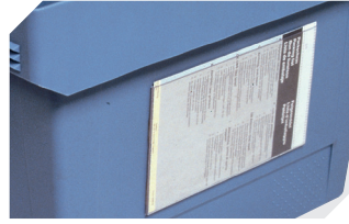
Pochettes porte-documents fixation auto-adhésive 3 côtés ouverts l 175 x l 105 mm 6-5031