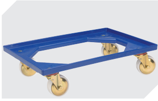
Plateaux roulants matériel des roues : PP l 620 x l 420 mm 43-1491