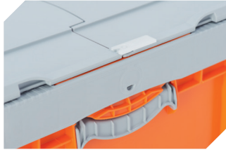
Scellés de sécurité avec marquage laser pour bacs pliables BITO EQ 51-31666