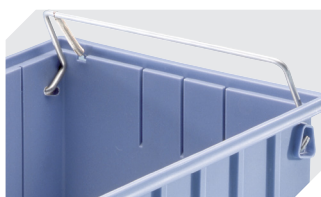
Poignée de sécurité/transport pour bacs de rangement RK et bacs CTB 3-31314