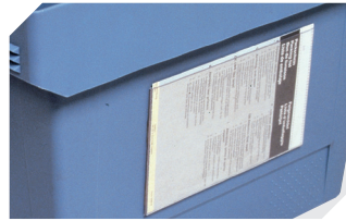
Etikettentaschen selbstklebend 3 Seiten offen L 175 x B 105 mm 6-5031