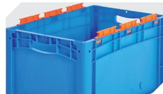
Côtés avec encoches porte-sacs peut être démonté 6-31553