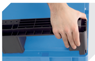
Kit de semelles pour bacs gerbables norme Europe, série XL 43-20273