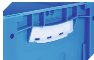
Obturateurs pour poignées ouvertes pour bacs gerbables norme Europe, série XL d'une hauteur de 170, 220 et 270 mm 43-31450