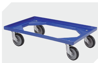
Plateaux roulants matériel des roues : caoutchouc l 620 x l 420 mm 43-21883