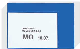
Pochettes porte-documents fixation auto-adhésive 2 côtés ouverts l 145 x l 100 mm 46-21108