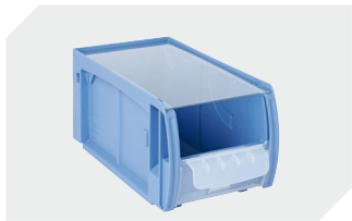
Staubdeckel CSD für C-Teile-Behälter CTB L 269 x B 148 mm 53-31341