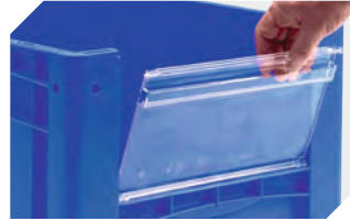
Sichtscheiben für Eurostapelbehälter XL B 460 x H 198 mm 43-22548