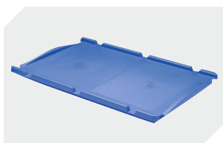
Couvercles indépendants pour bacs gerbables norme Europe, série XL l 400 x l 300 mm 43-20303