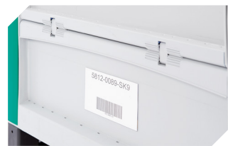
Porte-étiquettes 1 240 x H 80 mm 52-30386