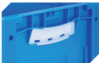
Obturateurs pour poignées ouvertes pour bacs gerbables norme Europe, série XL d'une hauteur de 170, 220 et 270 mm 43-31450