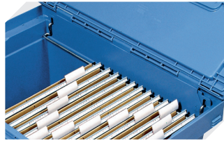
Hängemappenbügel für Mehrwegbehälter MB 6-11920