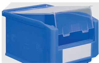
Couvercle fermeture complète pour bacs à bec, série SK l 71 x l 97/76 mm 2-19545