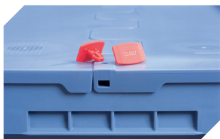
Scellés de sécurité MBP2-L - pour la BITOBOX MB, XL, SL 6-19162