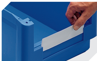
Protèges-étiquette pour bacs à bec, série SK l 98 x l 39 mm 2-1063