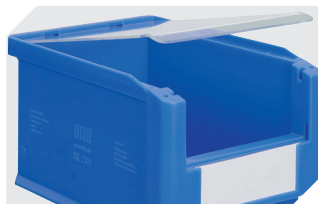
Couvercles anti-poussière pour bacs à bec, série SK l 224 x l 124 x H 2 mm 2-1137