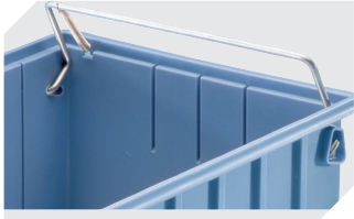
Sicherungs-/Tragebügel für Regalkästen RK 3-1514