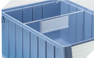
Querteiler für Regalkästen RK 3-1588