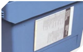
Etikettentaschen selbstklebend 3 Seiten offen L 175 x B 105 mm 6-5031