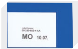
Etikettentaschen selbstklebend 2 Seiten offen L 145 x B 100 mm 46-21108