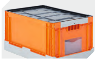
Auflagedeckel für BITOKLAPPBOX EQ L 592 x B 392 mm 51-31437