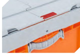
Plomben für BITOKLAPPBOX EQ 51-31438