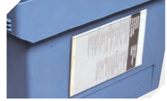
Etikettentaschen selbstklebend 3 Seiten offen L 175 x B 105 mm 6-5031