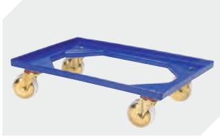
Transportroller Material Rad: PP L 620 x B 420 mm 43-1491