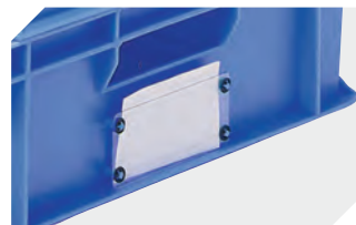
Etikettenabdeckungen für Eurostapelbehälter BN nachrüstbar B 110 x H 46 mm 4-9454