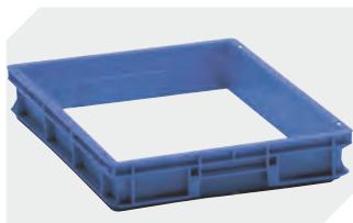
Aufsatzrahmen L 600 x B 400 x H 78 mm 4-1568