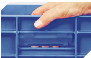
Griffverschlüsse für Eurostapelbehälter BN 4-18671