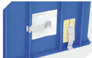
Dokumentenklammern für Eurostapelbehälter L 80 x B 18 mm 4-1492