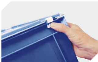
Deckel-Scharnier-Verschlüsse für Eurostapelbehälter BN 4-1144