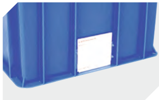
Etikettenabdeckungen für Eurostapelbehälter BN montiert B 110 x H 46 mm 4-1072