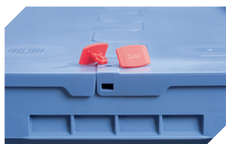
Scellés de sécurité MBP2-L - pour la BITOBOX MB, XL, SL 6-19162