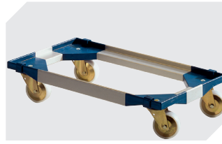
Transportroller für Mehrwegbehälter 800 x 400 mm und 800 x 600 mm L 720 x B 540 mm 6-19439