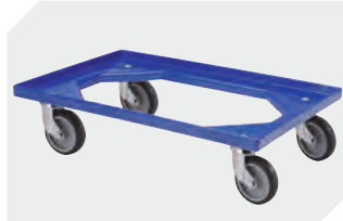
Transportroller Material Rad: Gummi L 620 x B 420 mm 43-21883