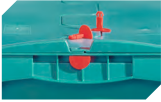
Plomben für Eurostapelbehälter XL und Kleinladungsträger KLT 9-16271