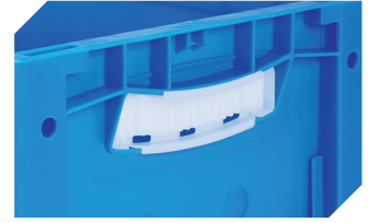
Griffverschlüsse für Eurostapelbehälter XL Höhe 170, 220 und 270 mm 43-31450