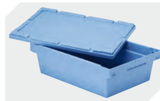
Stülpedeckel für Mehrwegbehälter MB L 800 x B 600 mm 6-22546