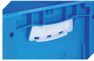
Obtrateurs pour poignées ouvertes pour bacs gerbables norme Europe, série XL d'une hauteur de 170, 220 et 270 mm 43-31450