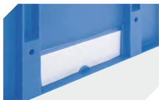
Etikettenabdeckungen für Mehrwegbehälter MB B 60 x H 80.4 mm 6-15244