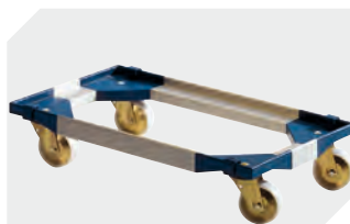
Transportroller für Mehrwegbehälter 800 x 400 mm und 800 x 600 mm L 720 x B 540 mm 6-19439