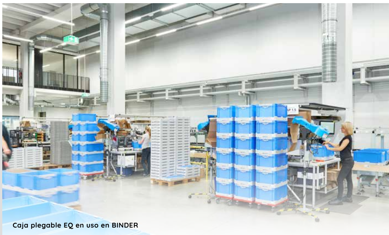
Caja plegable EQ en uso en BINDER

Ahorran espacio, son versátiles y pueden utilizarse incluso en almacenes automáticos. Nuestros competentes expertos internos estarán encantados de proporcionarle más información. ¡Póngase en contacto con nosotros hoy!