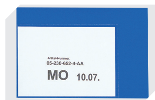
Pochettes porte-documents fixation auto-adhésive 2 côtés ouverts l 145 x l 100 mm 46-21108