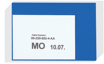
Etikettentaschen selbstklebend 2 Seiten offen L 145 x B 100 mm 46-21108