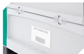
Porte-étiquettes 1 240 x H 80 mm 52-30386