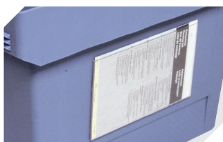
Pochettes porte-documents fixation auto-adhésive 3 côtés ouverts 1 175 x 1 105 mm 6-5031