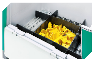
Séparateurs emboîtables en longueur 1 724 x 1 5 x H 180 mm 52-30385