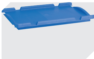
Couvercles indépendants pour bacs gerbables norme Europe, série XL l 300 x l 200 mm 43-30392