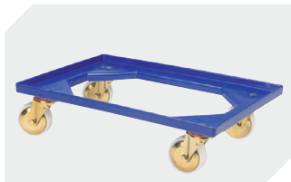
Plateaux roulants matériel des roues : PP l 620 x l 420 mm 43-1491