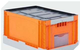
Couvercles indépendants pour bacs pliables BITO EQ l 592 x l 392 mm 51-31437