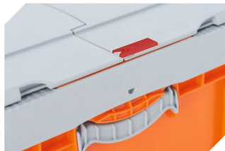
Scellés de sécurité pour bacs pliables BITO EQ 51-31438