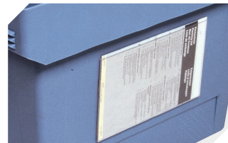
Pochettes porte-documents fixation auto-adhésive 3 côtés ouverts l 175 x l 105 mm 6-5031