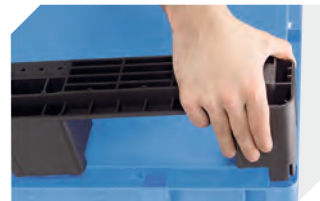
Kufensets für Eurostapelbehälter XL 43-20273