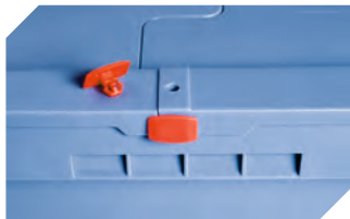
Plomben MBP2 - für BITOBOX MB 6-15705