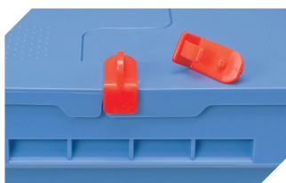
Clips de fermeture pour BITOBOX MB 6-20299