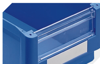
Visière pour bacs à bec, série SK 2-11969